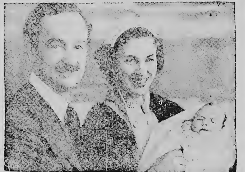
MAYOR TUFTON BEAMISH, lid van het Britse Parlement, en zijn Amerikaanse echtgenote, die in Engeland bekend staat als „de mooiste vrouw van Westminster” hebben hun kind van twee maanden te Londen in het gebouw van het Lagerhuis laten dopen.